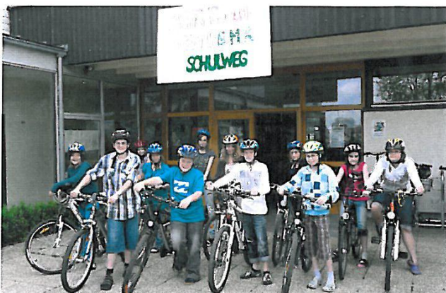
Gemeinsam per Rad macht der Schulweg mehr Spaß- und gesund ist es auch!

strampelten unsere Mädchen und Buben während des gemeinsam mit der Gemeinde durchgeführten und noch immer laufenden Mobilitätsprojektes. Nicht nur, dass der Verkehr rund um das Schulhaus eingedämmt wurde, auch CO 2 wurde eingespart und der Feinstaub verringert. Während der Aktions-