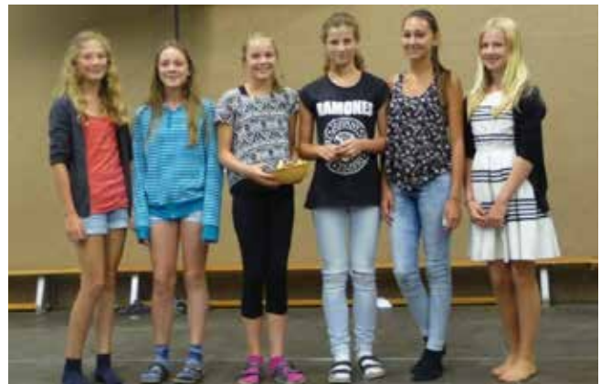
Die Mädchen der Altersgruppe D schafften den 3. Platz.