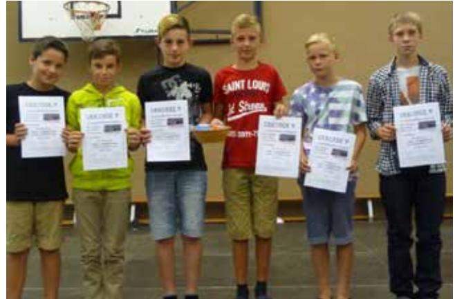
Die Buben aus der 1. und 2. Klasse erreichten den 2. Platz

Traditionell zum Schulschluss kämpften 72 Mannschaften aus 17 Schulen um die Medaillen beim Bezirks-Leichtathletik-Wettbewerb. Wir haben zwei Mannschaften ins Rennen geschickt. Beide Teams kamen mit einem Stockerlplatz nach Hause.