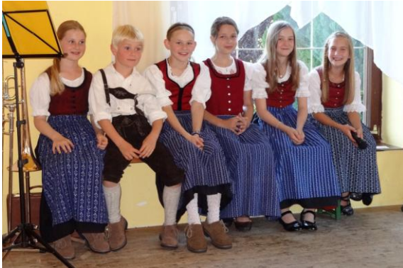
3 Musiker und die 4 Moderatorinnen

Samstag, 16. Juni 2012, Gasthaus Maier in Abern.