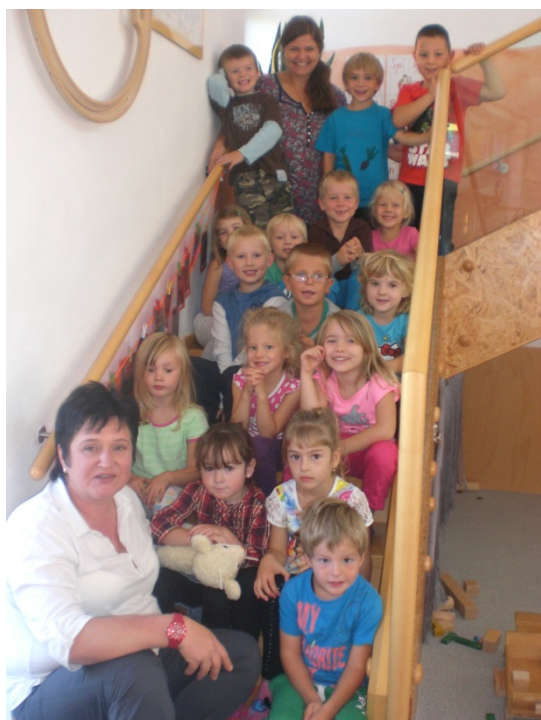
Gruppe 1 (Integrationsgruppe, linkes Bild )

Mit frischem Elan starten wir in das neue Kindergartenjahr 2014/2015 und möchten uns kurz vorstellen: